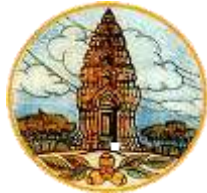
ศรีสะเกษ