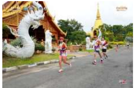
เส้นทาง อำนาจเจริญ EXTRA RUN MINI MARATHON โขง ชี มูล วันที่ ๕-๖ สิงหาคม ๒๕๖๖