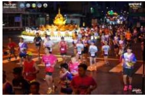
เส้นทาง อุบลราชธานี MINI MARATHON โขง ชี มูล วันที่ ๒๙-๓๐ กรกฎาคม ๒๕๖๖