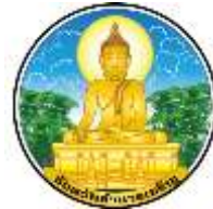
อำนาจเจริญ

รายงานผลการดำเนินงาน ประจำปีงบประมาณ พ.ศ. 2566