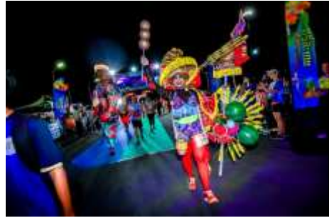
เส้นทาง ยโสธร NIGHT RUN MINI MARATHON วันเสาร์ที่ ๘ กรกฎาคม ๒๕๖๖